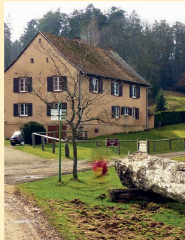
La maison forestière du Willerhof.

Prendre la route forestière balisée anneau bleu vers le carrefour du Kreuzweg. Puis à gauche, poursuivre sur le sentier toujours balisé anneau bleu qui débouche sur une route forestière. Suivre sur 200m puis tourner à gauche et prendre le chemin forestier balisé croix bleue qui contourne le promontoire rocheux du château de Kagenfels puis monter à droite vers ce dernier par le sentier balisé croix bleue (visite). Continuer sur le balisage croix bleue jusqu'à la route forestière. Prendre à gauche sur 50 m puis à droite sur le balisage anneau bleu. Après 10 mn, passer la route et continuer sur l'anneau bleu pour arriver à la maison forestière du Willerhof. Suivre la route forestière, prendre à droite le sentier balisé croix jaune et avant le château du Birkenfels prendre à droite le sentier balisé avec l'anneau bleu qui ramène au parking.